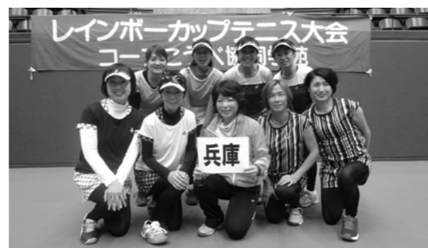
昨年度の団体優勝チーム〔兵庫県〕の皆さん