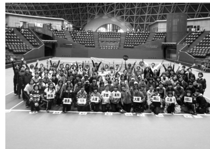
昨年度決勝大会参加の皆さん