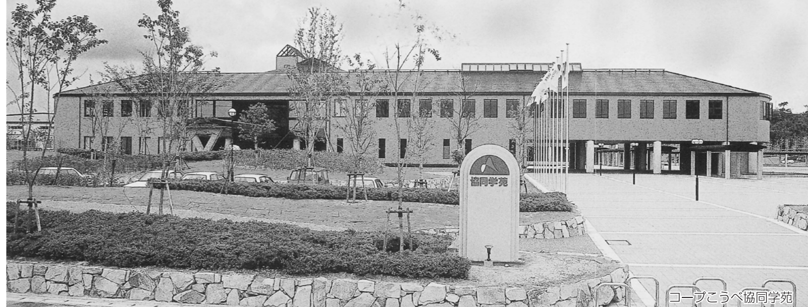
コープこうべ協同学苑